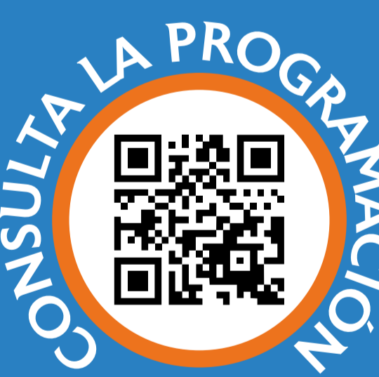
Ilustración: Andrés Estrada